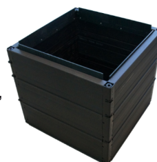
ROM-Box 60/60 mit Innenschalung

Die neue ROM-Box GALA 60/60 ist ein quadratischer Kunststoff-Kabelschacht aus 100%recyclebarem Polypropylen mit leichter Composite-Abdeckung (Kunststoff). LW 600x600 mm. Der Einsatzbereich dieser ROM-Box mit Composite Abdeckung ist auf Anwendungen bis Gruppe 2 (EN 124, Klasse B 125) beschränkt! Kunststoff-Abdeckung mit 2-fach Arretierung aus Edelstahl, Bauhöhe Abdeckung = ca. 100 mm. Die ROM-Box mit LW 600x600 wird komplett aus Extrusionselementen gefertigt, d.h. glatte Außen- und Innenwand. Eine Innenschalung wird mit Überstand zum obersten Profil befestigt und dient als Verschiebesicherung des Abdeckungsrahmen. Getrennte Lieferung von Schacht und Abdeckung, keine fixe Montage. Außenmaße: 680 x 680 mm. Die ROM-Box GALA 60 60 wird in 2 Höhen angeboten: Gesamthöhe 700 - 750 mm oder 800 - 850 mm.