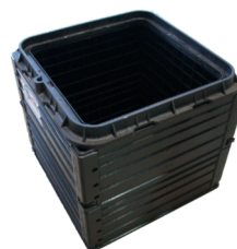
ROM-Box 40/40 mit aufgeschraubtem Rahmen

Der fix montierte Rahmen der Abdeckung wird mittels Edelstahl-Schrauben direkt auf die ROM-Box geschraubt. Der Deckel wird durch 4 Kunststoff-Schrauben gesichert. Außenmaße: 485 x 485 mm. Gesamthöhe der ROM-Box GALA 40 40: 440 mm.