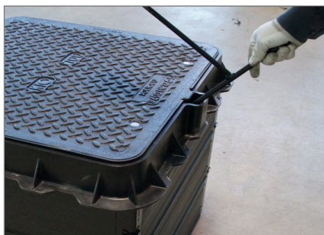
Öffnen der Abdeckung mit US-3 ROM-Box SD