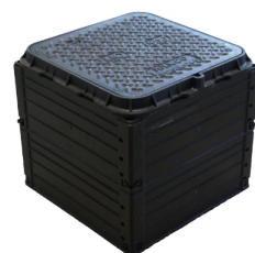
ROM-Box 405x405 mit Abdeckung