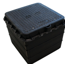
ROM-Box 60/60 mit Abdeckung